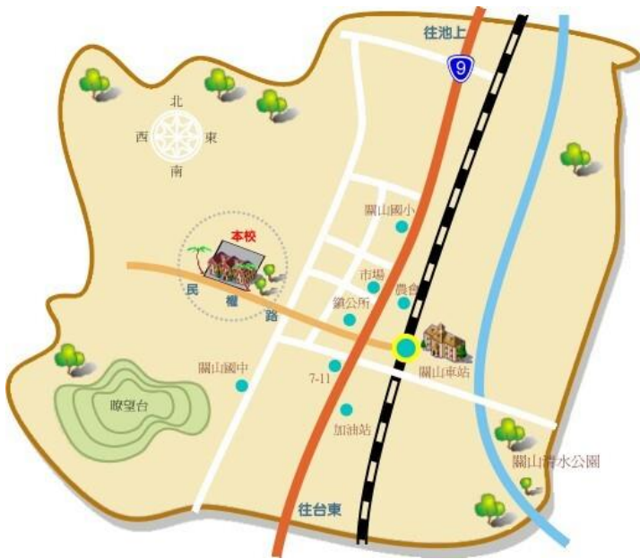
附圖一 承辦學校位置圖